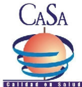
Ca.Sa. Calidad en Salud